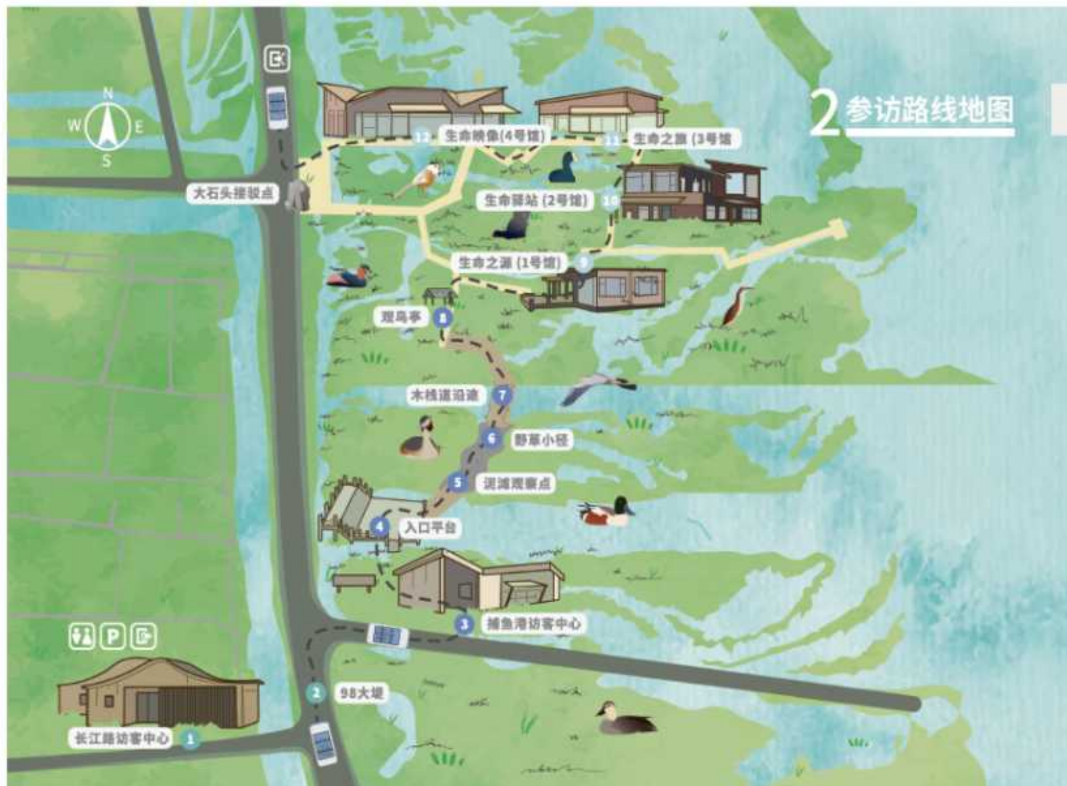
图 1-2 《东滩自然一刻人员解说手册》部分内容

本线人员解说方案，将针对初次来东滩的大众访客，以自然一刻主题步道为基础，借助人员解说和自助参观的形式，带领访客认识步道的生物多样性，从中认识东滩湿地生物多样性的特点，及其生物与东滩湿地之间密切的依存关系。同时，考虑人员解说活动的整体性，解说方案将适当结合长江路访客中心以及后续生命之源等四馆的人员解说内容，进行总体规划与讲解内容设计。