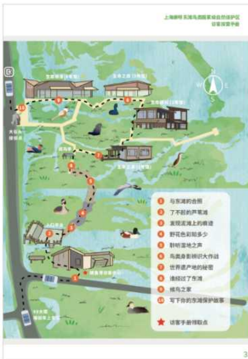
《东滩自然一刻访客体验手册》部分内容