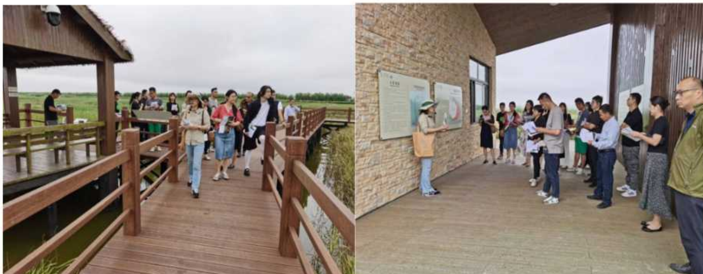
图 4-5：东滩自然一刻公众导赏活动