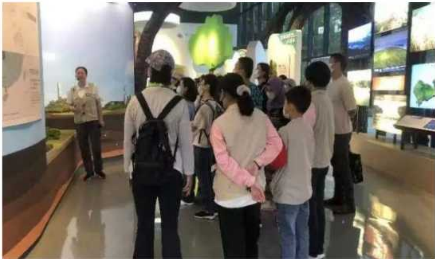
MCF 工作人员指导志愿者开展工作

MCF 教育部门工作目标明确，合理运用工作人员的亲和力与专业性，开展了一系列包括社会公众教育、志愿者教育、中小学自然课堂教育等丰富的课堂活动；在分享知识方面，咱们可谓是毫无保留。