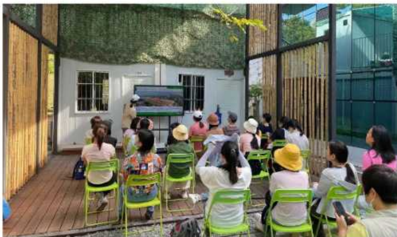
先上课、再上岗。图为新一期志愿者在接受基础培训。