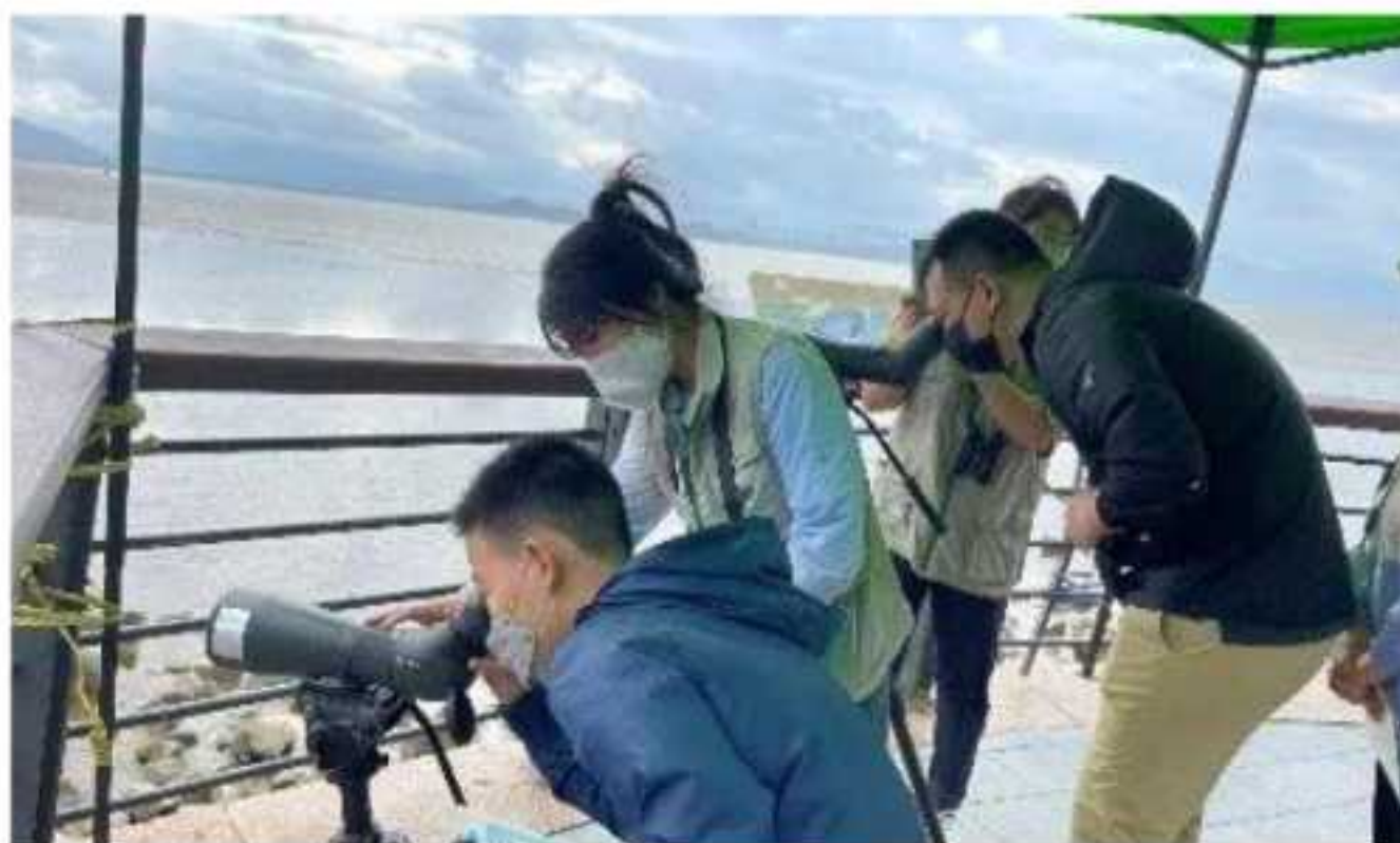
定点观鸟活动是最受公众欢迎的活动之一，也是志愿者争抢报名的焦点。志愿者会进行讲解和引导公众观察鸟类，和不同的公众朋友交流，双方都能收获满满，很有意思。