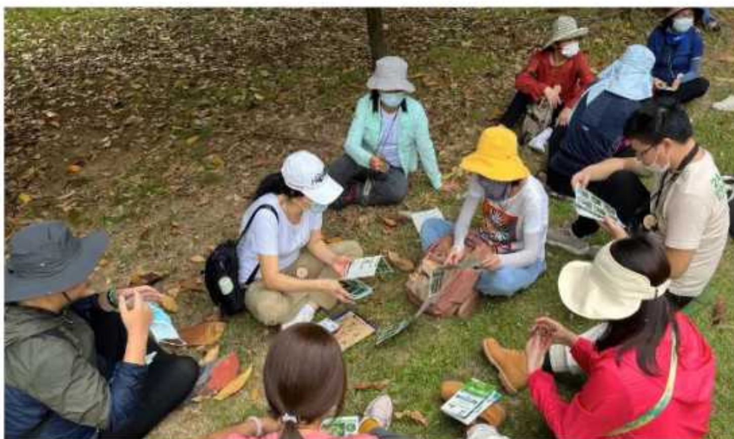
培训课程的实践部分大多在户外进行。志愿者席地而坐，学习分辨各种红树植物种子与果实。