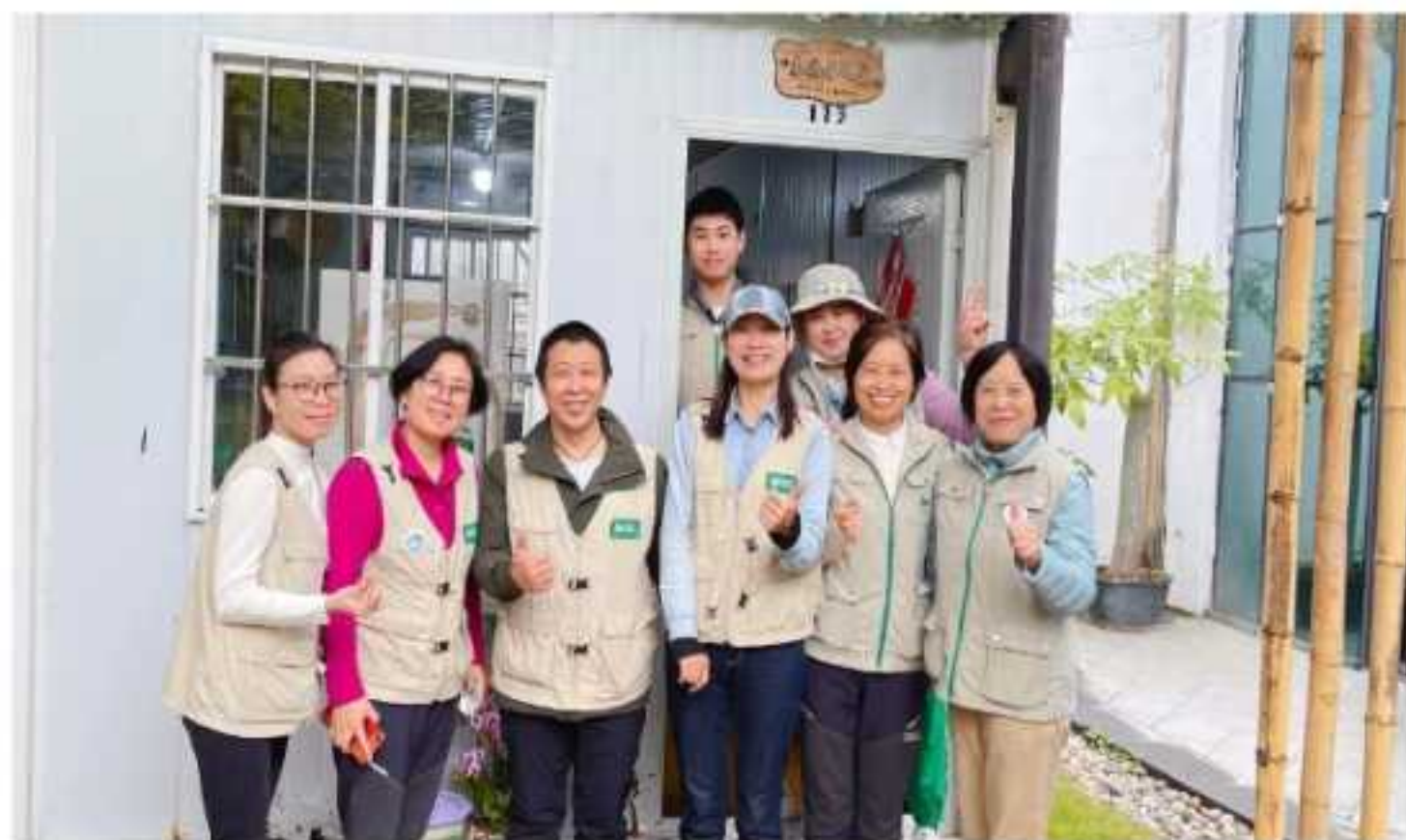
志愿者在完成当日服务后，聚集在志愿者之家门前，留下温馨合影。