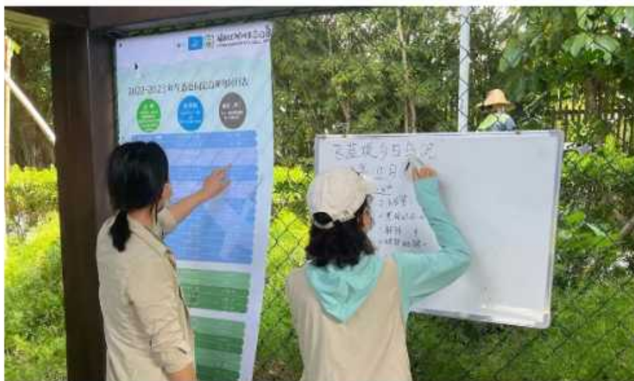
经验丰富的观鸟志愿者在填写“今日鸟况”，方便游客认鸟。

根据自身情况参加不同的活动；工作党和学生党也不用担心，周一至周日都有多样选择。这些活动涉猎广泛，志愿者甚至有机会成为“公民科学家”，参与候鸟全球调查，为物种保护贡献一份自己的力量。从运营支持到科学调查，每个活动都充满了意义，让人流连忘返。