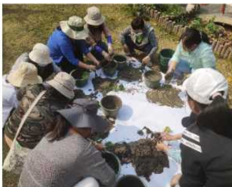
志愿者们在翻荷花盆

3月15日，红树林基金会（MCF）深圳湾教育团队开展了2023年深圳湾公园自然教育中心运营志愿者培训，此次培训共有15名志愿者参加，并且全部通过考核，志愿者们上午进行了自然教育中心运营内容学习，下午进行了堆肥与荷花翻盆相关内容的学习，并进行了实践。这吸引了不少新老志愿者们前来切磋技艺，武功升级！这不，大家撸起袖子，说干就干！