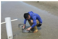
工作人员开展食物调查

利用已有或者已发表的卫星遥感数据，识别4种候鸟类在中国沿海的主要栖息地（越冬地和迁徙停歇地），选定25个最重要的栖息地进行长期的食物调查。